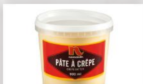
Pâte à crêpes 6 49 8 portions