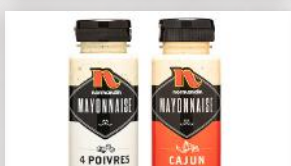
Mayonnaise maison 4 89 4 poivres ou cajun