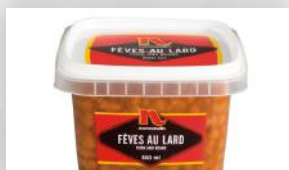
Fèves au lard 3 59 500 ml