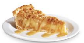
Tarte aux pommes 13 99 10 portions