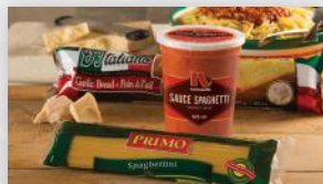
Spaghetti pour 4 13 99 Sauce spaghetti, pâtes, pain à l'ail