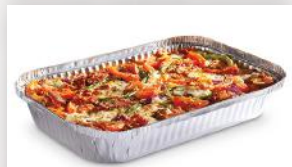
Lasagne suprême 20 79 Format familial