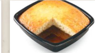
Pouding chômeur à l'érable 10 99 630 g