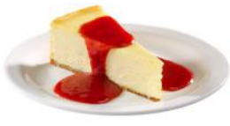
Gâteau au fromage 21 99 14 portions