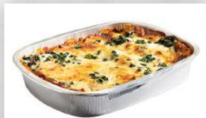
Lasagne végétarienne 19 79 Format familial