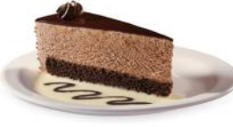
Gâteau mousse au chocolat 19 99 14 portions