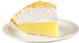
Tarte à la noix de coco 10 99 6 portions