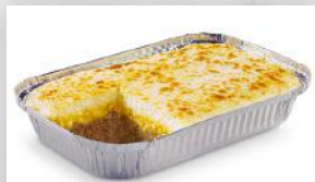
Pâté chinois 17 69 Format familial