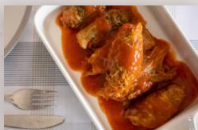
Cigares au chou 12 99 2 portions

Planifiez vos repas pour chaque jour de la semaine