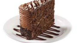
Gâteau au chocolat 21 99 14 portions