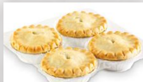
Mini-pâtés à la viande 5 69 5 unités