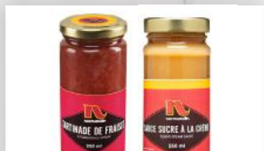
Tartinade Fraises ou sucre à la crème 5 99 250 ml