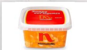
Soupe aux légumes 4 99 925 ml 9 79 2,6 l