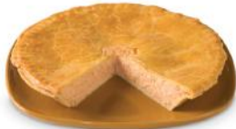
Pâté au saumon 11 59 6 portions