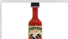
Sauce piquante Firebarns 4 29 53 ml