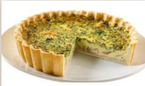
Quiche jambon et épinards 16 99 1,2 kg