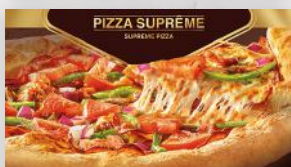
Pizza Suprême 17 49 12 po