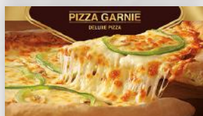
Pizza garnie 13 29 12 po