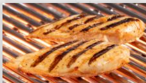
Poitrine de poulet mariné (1) 3 95