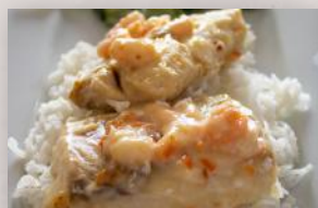
Aiglefin sauce aux crevettes 15 99 2 portions

Savourez-les avec votre accompagnement préféré. Prêts en 10 minutes.