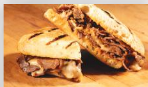
Sandwich artisan Bœuf Kansas (1) 8 75

Soyez assurés que nous respectons les directives de l'Agence de la santé publique du Canada et que toutes les précautions nécessaires sont mises en place et respectées afin de protéger la santé de nos employés et celle de notre clientèle. Prix sujets à changements.