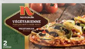
Pizza gourmet végétarienne 13 50 2 unités