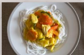
Poulet thaï 11 99 2 portions