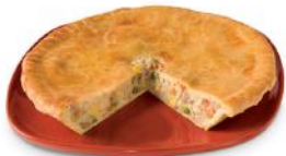
Pâté au poulet 12 29 6 portions