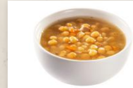
Soupe aux pois 6 99 900 ml