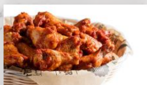
Ailes de poulet BBQ 14 39 20 unités