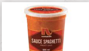
Sauce spaghetti 6 29 500 ml 9 99 900 ml 21 99 2,6 l