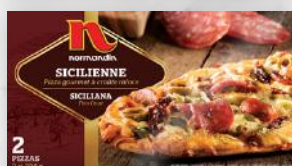
Pizza gourmet sicilienne 13 50 2 unités