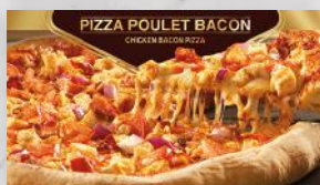
Pizza poulet bacon 15 99 12 po