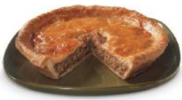
Pâté à la viande 12 79 6 portions