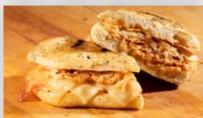
Sandwich artisan Poulet club (1) 7 25