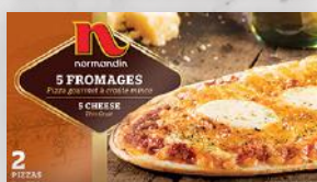
Pizza gourmet 5 fromages 13 50 2 unités