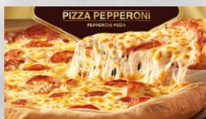
Pizza pepperoni 13 29 12 po