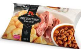
Jambon artisan à l'érable 12 79 600 g