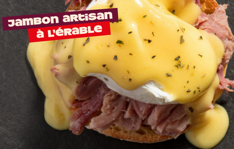
Jambon artisan à l'Érable