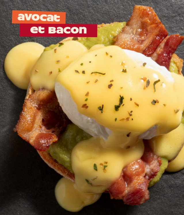
avocat et Bacon