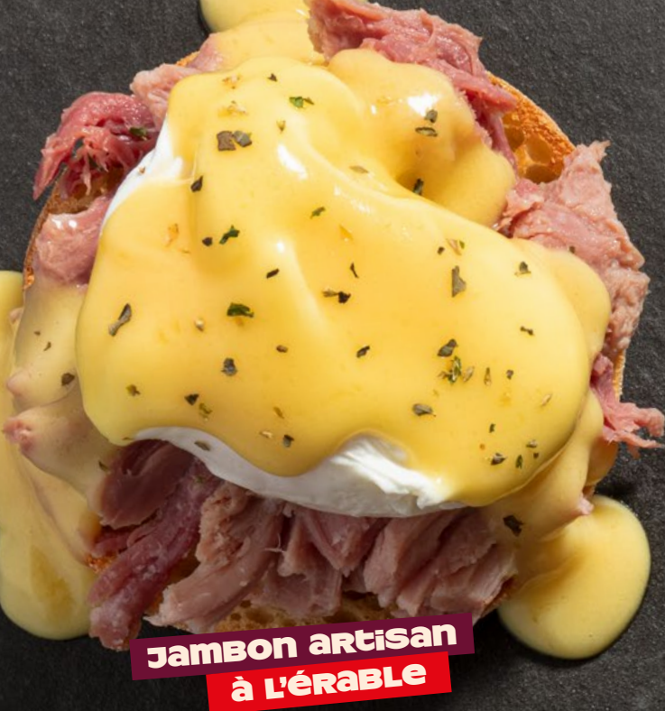
Jambon artisan à l'érable