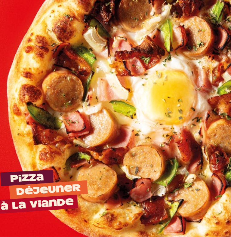
Pizza DÉJEUNER à La Viande