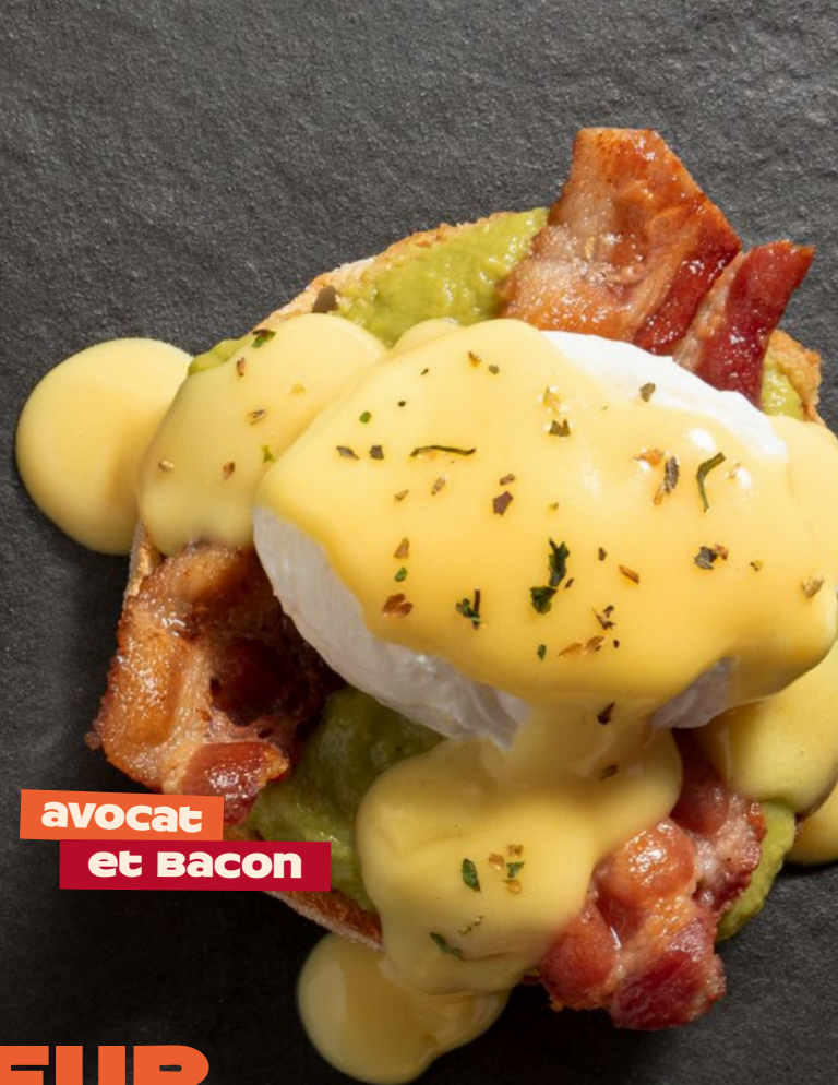
avocat et Bacon