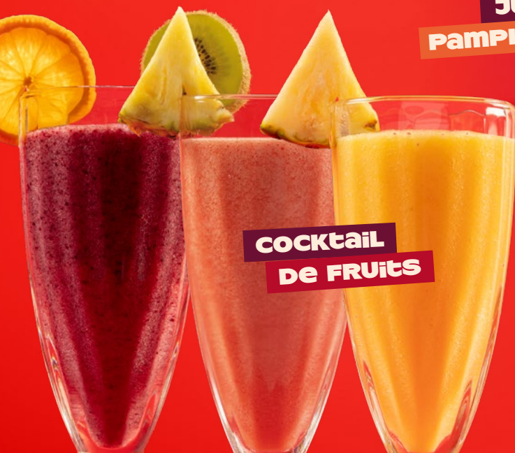
cocktail de fruits