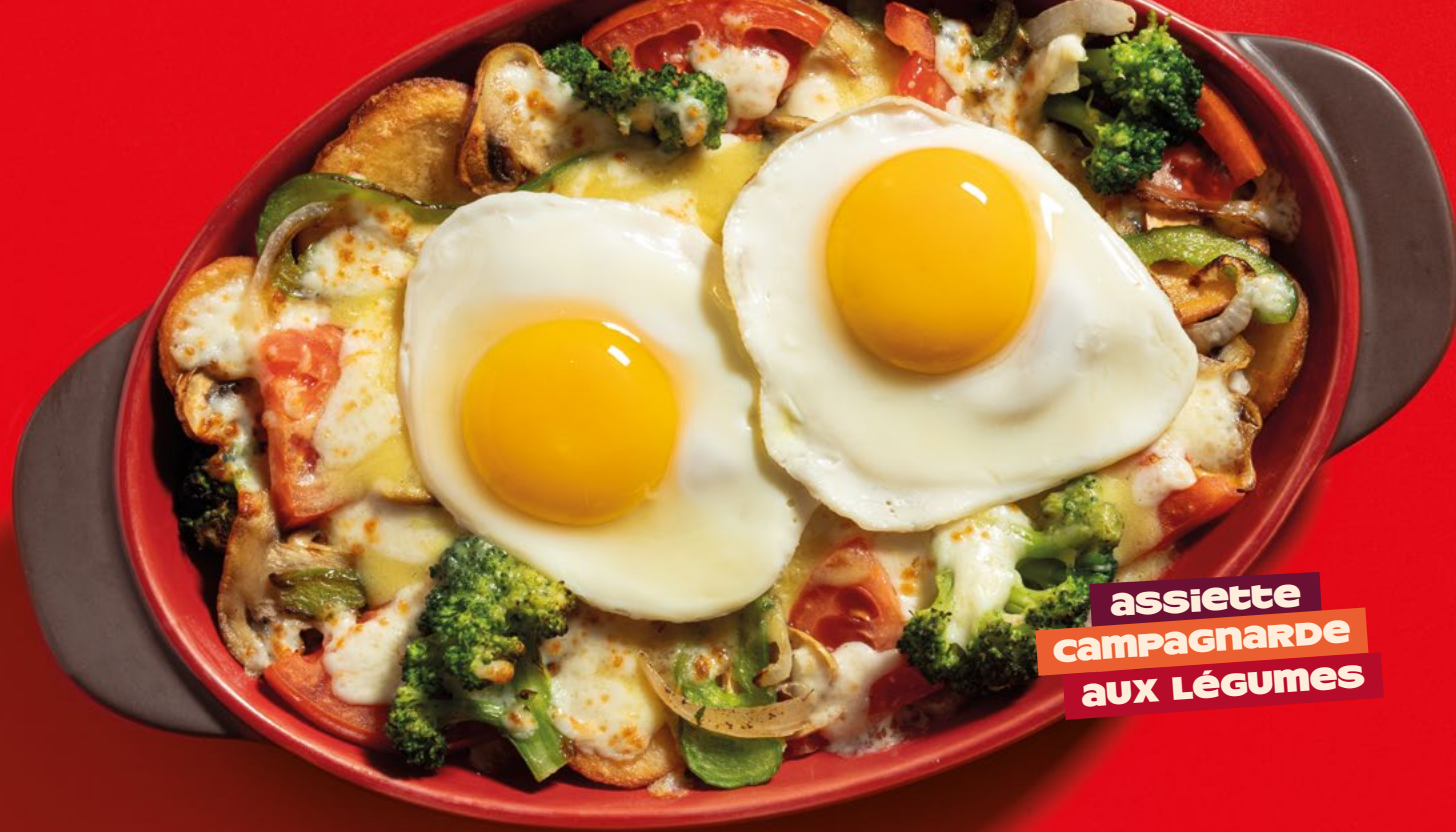
assiette campagnarde aux légumes